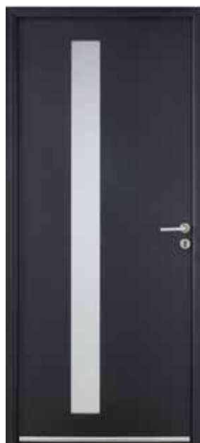
NANDA Ud : 1,4 W/m 2 .K