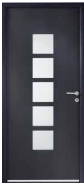
FUJI Ud : 1,4 W/m 2 .K