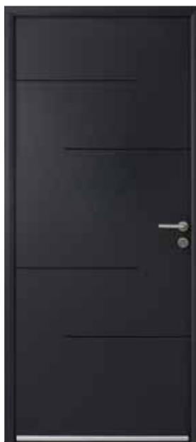
SANCY Ud : 1,1 W/m 2 .K