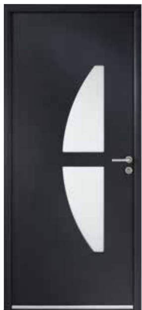
OURAL Ud : 1,4 W/m 2 .K