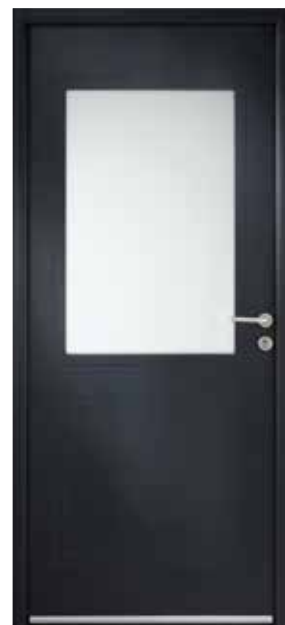
VOSGES Ud : 1,4 W/m 2 .K

Modèles présentés en Gris anthracite RAL 7016 sablé.