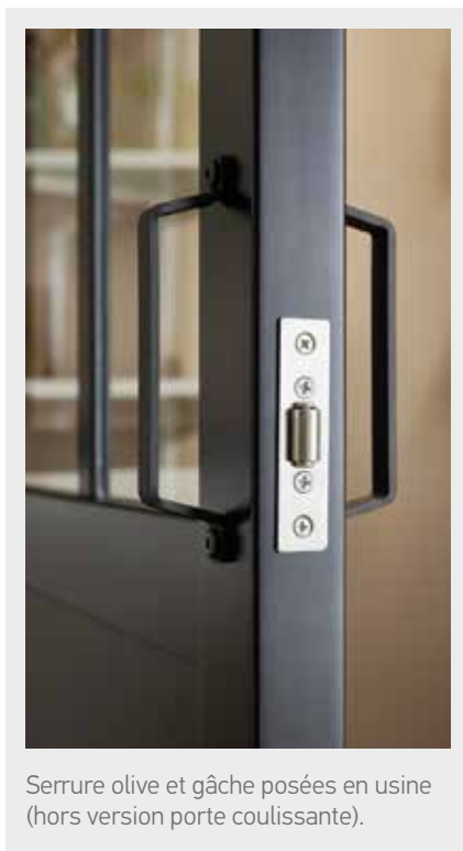
Serrure olive et gâche posées en usine (hors version porte coulissante).